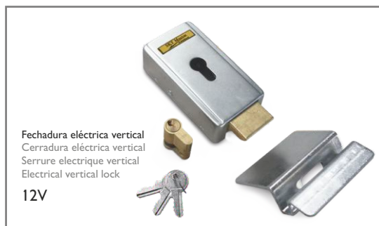
Fechadura eléctrica vertical Cerradura eléctrica vertical Serrure électrique verticale Electrical vertical lock 12V