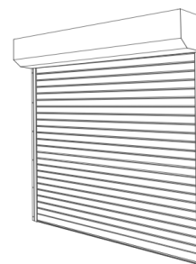
GRADES DE ENROLAR