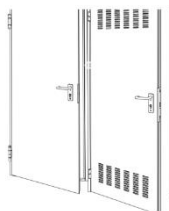
PORTAS MULTIUSO / CORTA-FOGO

Com este investimento, pretende-se introduzir sistemas avançados de produção com elevados níveis de integração de processos e interação com os sistemas de informação já existentes. A introdução / incorporação no fluxo produtivo das linhas de acessórios e embalagem permitirá à empresa múltiplos ganhos, quer ao nível da sua eficiência e eficácia (lead time, desperdícios, redução do peso do CEVC - aumento margem bruta) quer ao nível do catálogo de produtos disponibilizados.